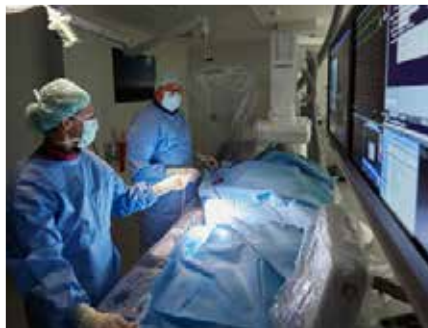
Foto: im Herzkatheterlabor

...kann bei Verengungen oder Verkalkungen der Gefäße unmittelbar während der Koro z.B. ein Stent implantiert werden. In diesem Fall kann die Untersuchung mehr Zeit beanspruchen.